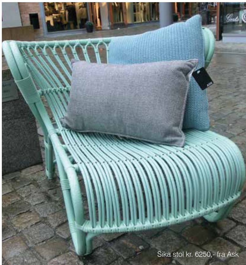
Sika stol kr. 6250,- fra Ask