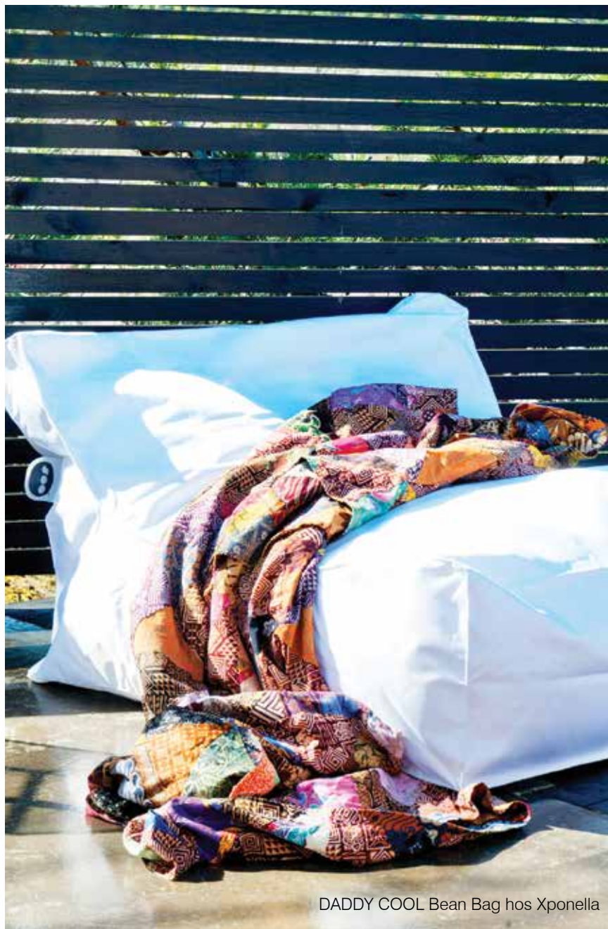
DADDY COOL Bean Bag hos Xponella