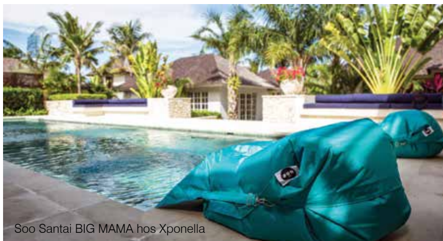
Soo Santai BIG MAMA hos Xponella